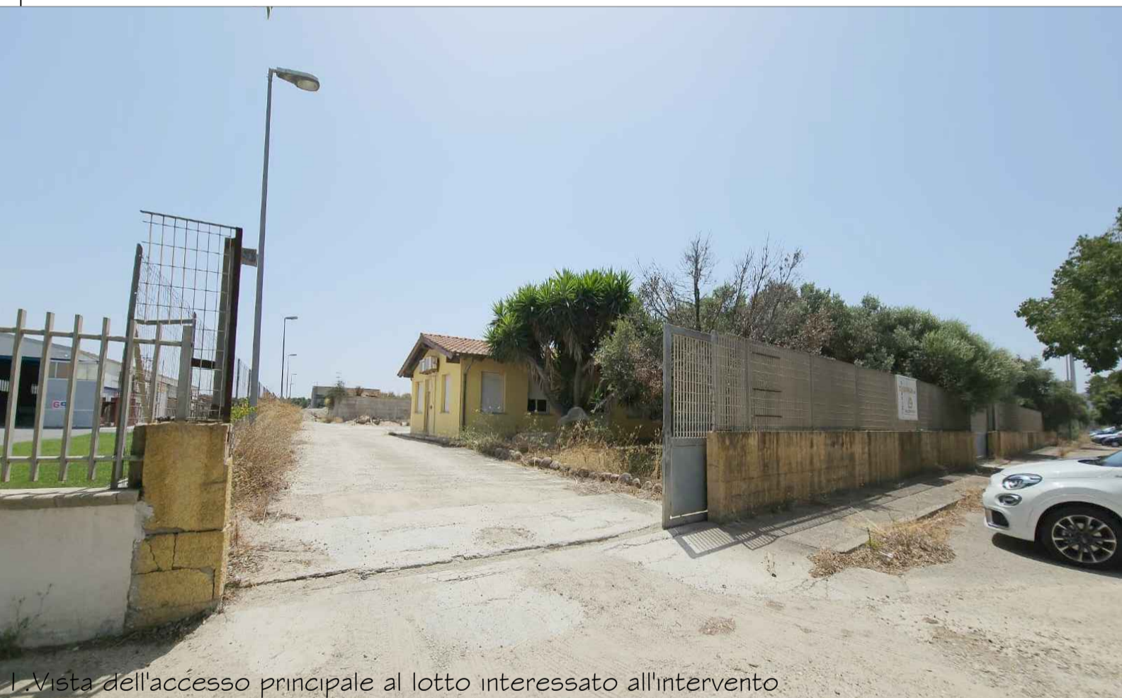
1. Vista dell'accesso principale al lotto interessato all'intervento.