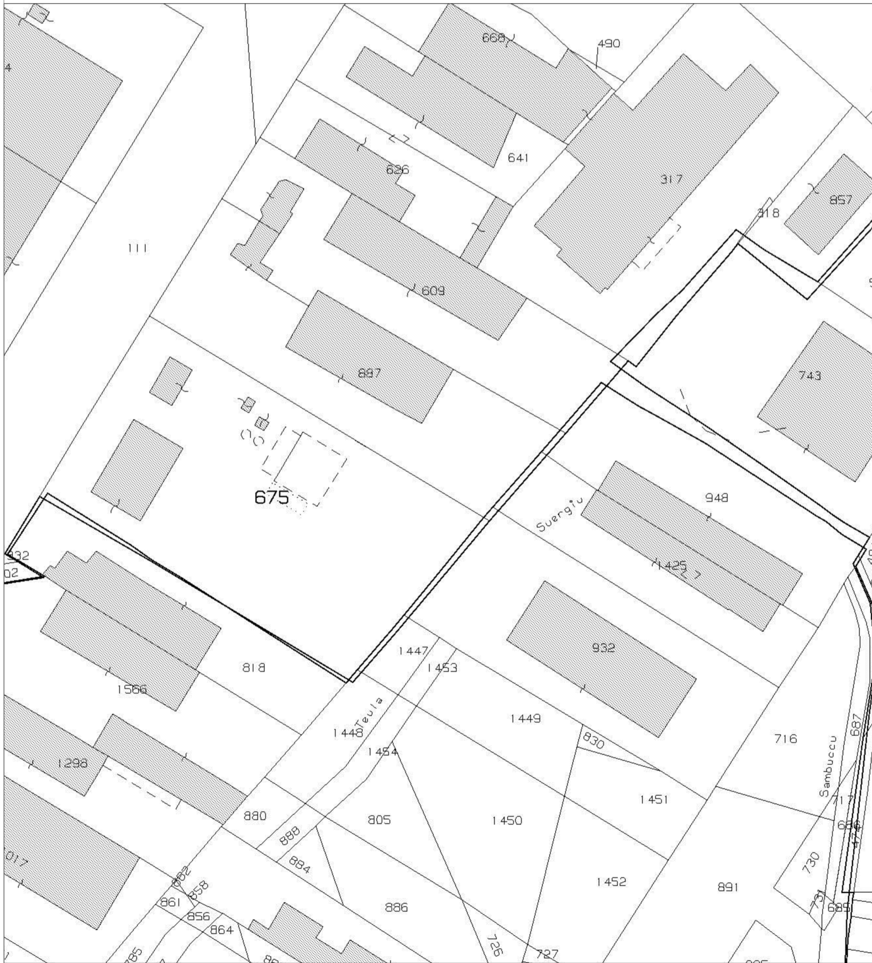
Guspini - Individuazione catastale dell' area d'intervento foglio 325 mappale 675- foglio 331 mappale 1447,1453,1449,830,1451- scala 1 : 2000