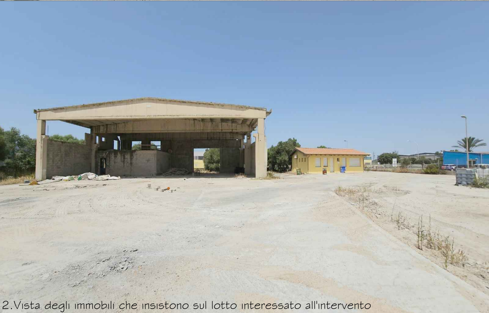
2. Vista degli immobili che insistono sul lotto interessato all'intervento